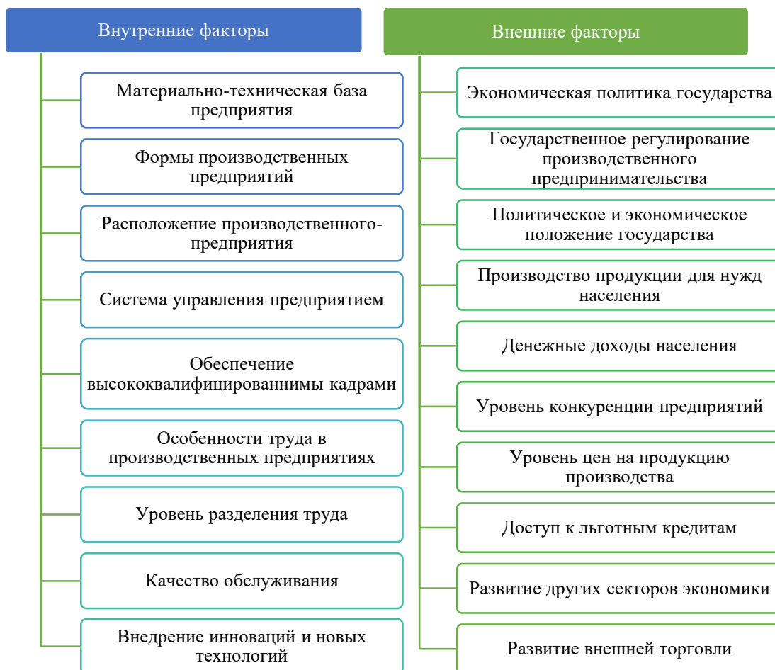
Рисунок 2. Основные факторы, влияющие на развитие производственных предприятий в СЭЗ