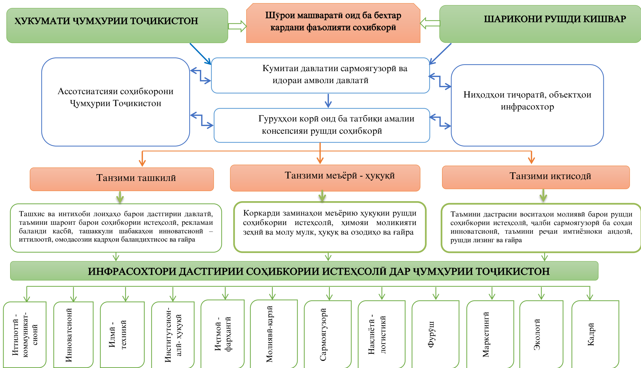
Расми 3. Механизми самараноки ташкилию иқтисодии рушди инфрасохтори соҳибкории истеҳсолӣ дар Ҷумҳурии Тоҷикистон