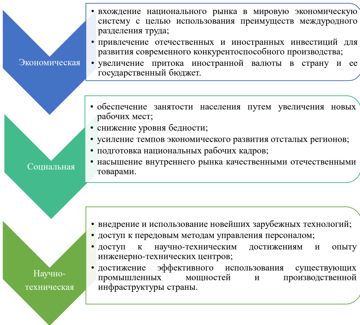
Рисунок 1. Основные цели создания свободных экономических зон