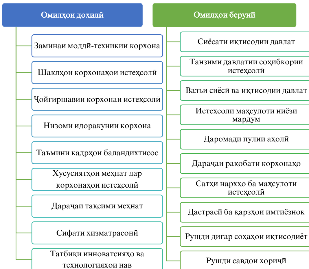
Расми 2. Омилҳои асосие, ки ба рушди корхонаҳои истеҳсолӣ дар МОИ таъсир мерасонанд