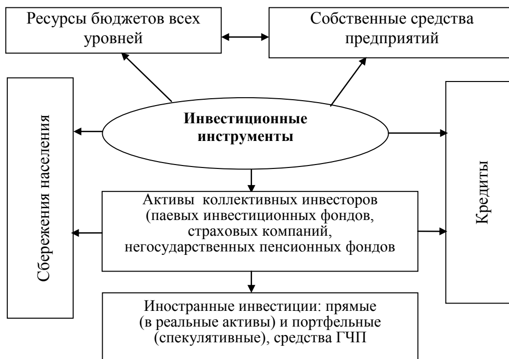
Рисунок 1. Инвестиционные инструменты развития сферы услуг

низмов инвестиционной поддержки, а также ГЧП. По мнению автора, инвестиционная стратегия носит функциональный характер и необходимо выделить основные направления инвестиционной деятельности предприятий сферы услуг, а также дать оценку эффективности, положительного или отрицательного синергетического эффекта от различных направлений этой деятельности. Поэтому важным считает выделение инвестиционных инструментов развития сферы услуг (рис.1).