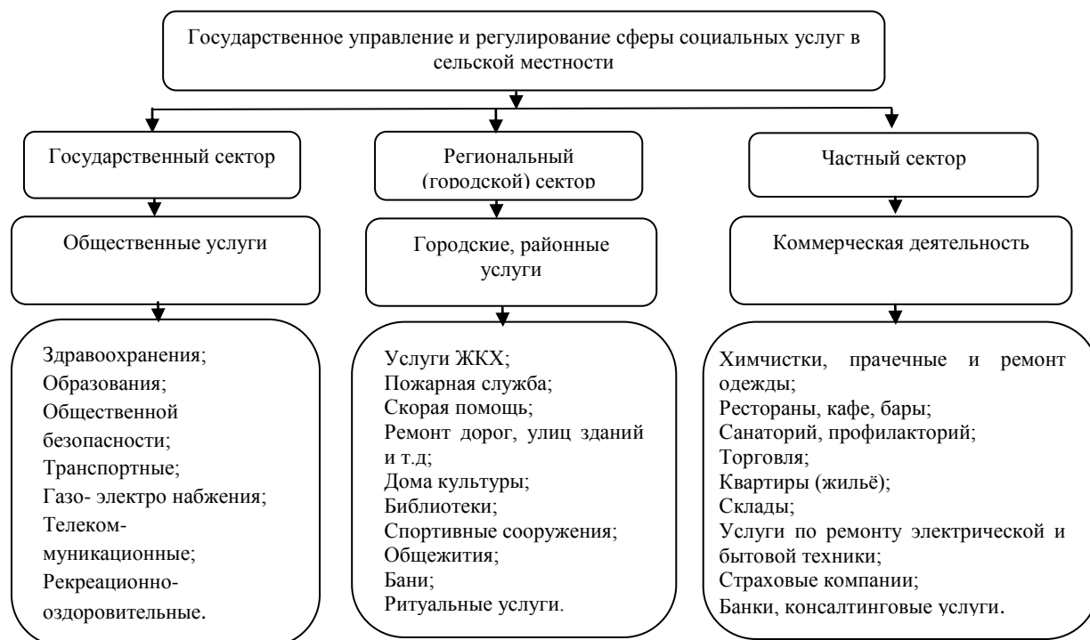
Рисунок.1. Формирование механизма управления сферы социальных услуг в сельской местности Республики Таджикистан

Переход от административно – командной экономики к рыночной экономике существенно изменил, управленческие функции государства и требует новых форм управления, отвечающих потребностям современных условий хозяйствования. При этом целесообразно разработать механизм управления сферы социальных услуг в сельской местности. Формирование механизма управления сферы социальных услуг в сельской местности Республики Таджикистан показано на рисунке 1.