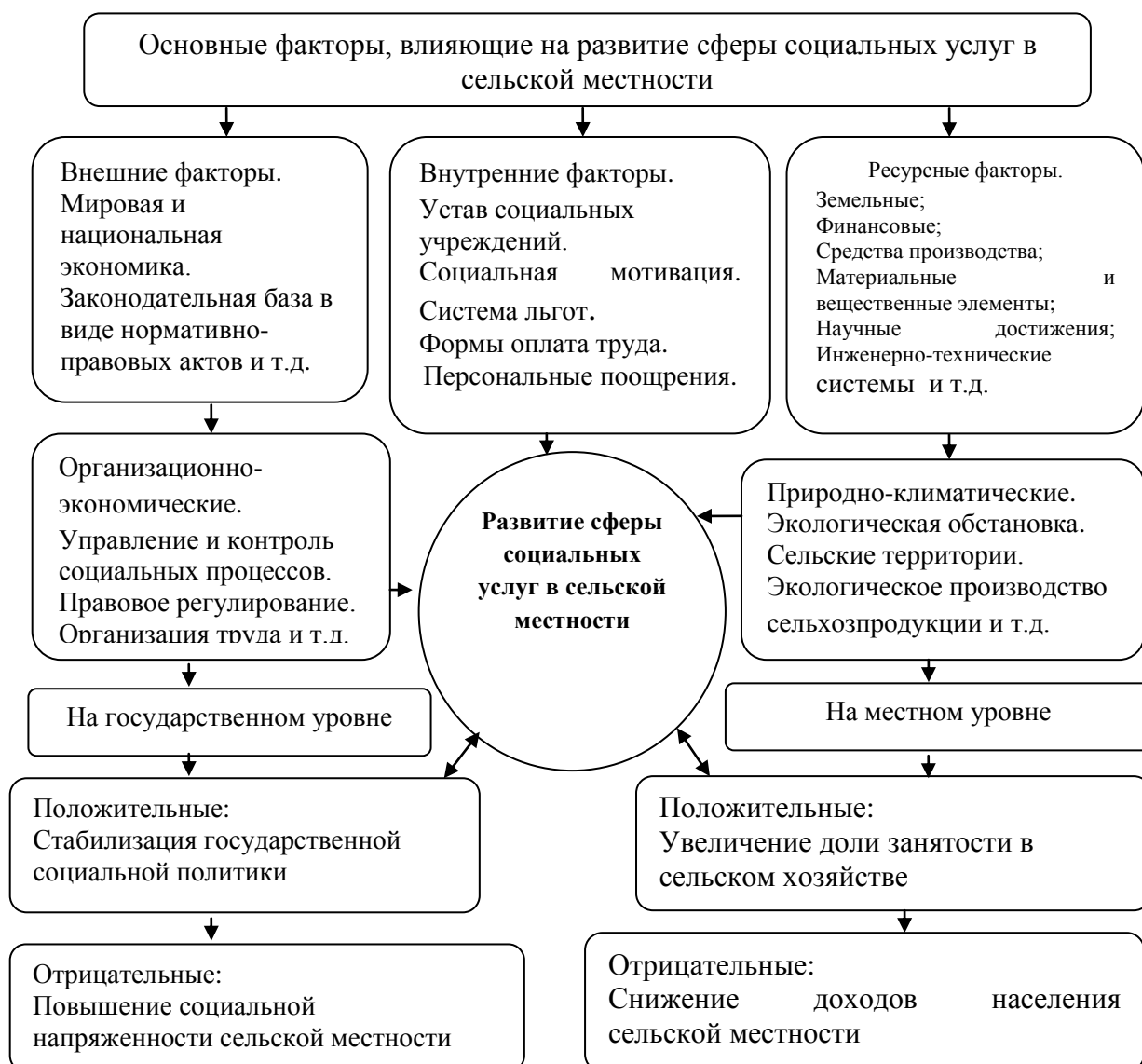
Рисунок. 2. Основные факторы, влияющие на формирование и развитие сферы социальных услуг в сельской местности

Эффективность функционирования и развития сферы социальных услуг в сельской местности, несомненно, зависит от факторов организационно - экономического характера. В контексте этих факторов лежат управление и контроль над социальными процессами, правовым регулированием и организацией трудовой сферы, касающихся развития сферы социальных услуг в сельской местности. Эти факторы, в сущности, составляют основу модели формирования и развития социальных услуг в сельской местности (рис. 2).